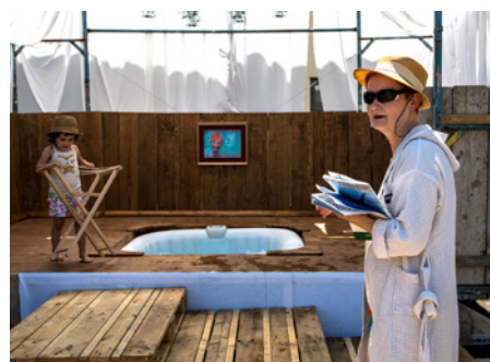
L'installation de Bains publics.

Poétique thalassothérapie urbaine, Bains publics est sans doute le projet qui symbolise le mieux la démarche du festival de la Cité Lausanne. Un collectif nommé Dakota, qui se présente comme un organisme d'alter-réalité, et une compagnie orientée vers les arts de la rue, les 3 points de suspension, ont décidé d'installer une zone de bien-être sur la Place des Tunnels. On pourra y faire pousser des salades avec l'eau du bain et se regonfler l'ego, y prendre un jacuzzi dans une voiture et renouer avec les slows. Une invitation à la déconnexion, à la lenteur et à se penser comme partie d'un tout – et d'un écosystème – au milieu du trafic urbain. Une installation participative politique et ludique.