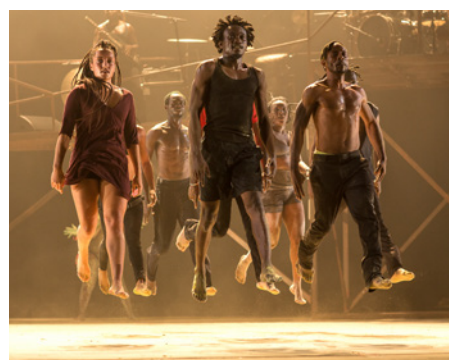
Monstres / On ne danse pas pour rien.